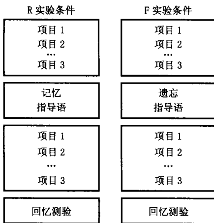
图 1 实验程序流程图

联系时记忆成绩比其他编码条件(如结构编码、音韵编码、语义编码、他人参照编码等)的记忆成绩好,并把这种现象称为自我参照效应(self reference effect SRE) [6] 。Conway(2000)认为自我是自传记忆的一部分,对自我的记忆属于自我记忆系统,这一系统中所有潜在被激活的目标构成“工作自我”,新知识可以通过它进入自传知识库,在编码过程中,无论这一信息与自我的关联是低还是高,都进入“工作自我”且得到保护,然后,一个固化的过程开始形成,与自我有较高关联的信息与自传信息库整合,而其它的信息则不能整合到自传知识库中 [7] 。